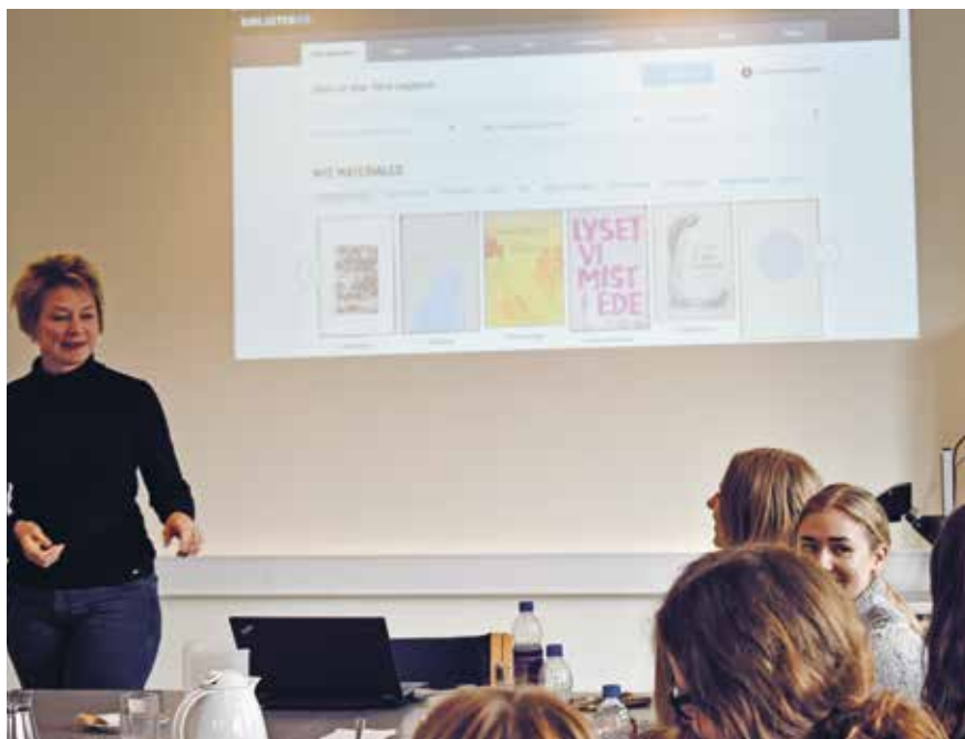
DBC har efterhånden tradition for at benytte Operation Dagsværk til at få input fra unge om bibliotek.dk.