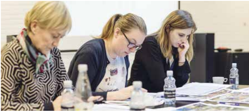
I løbet af projektperioden bliver der hver anden måned afholdt workshop som her på Rødovre Bibliotek i november 2017.

måned er der workshop, hvor en endnu større gruppe af biblioteksansatte bliver orienteret og kommer med input til det videre arbejde.